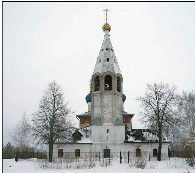
Объект культурного наследия